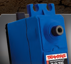
High-Torque Digital Steering Servo