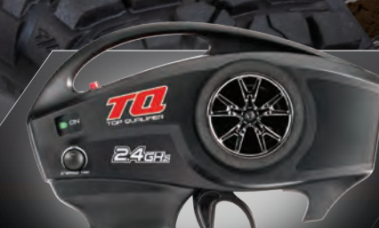
TQ™ 2.4GHz Radio System