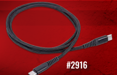
#2916 High-Output USB-C Power Cable