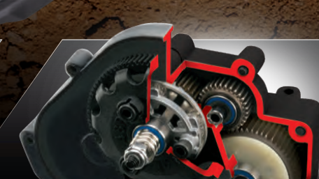
Torque-Control™ Slipper Clutch