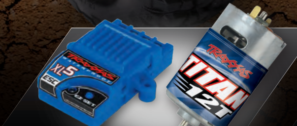
XL-5™ Electronic Speed Control and Titan® 12T 550 Motor