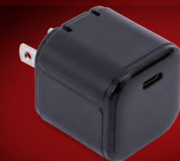
#2912 45-Watt USB-C AC Power Adapter

Use the Traxxas Power Adapter and Cable for Maximum Charging Performance (Sold Separately)