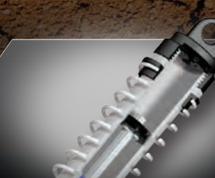
Oil-Filled Ultra Shocks™

NEW 4-AMP USB-C FAST CHARGER AND 8.4V NiMH BATTERY INCLUDED